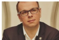
Wojciech Bakun prezydent Przemyśla