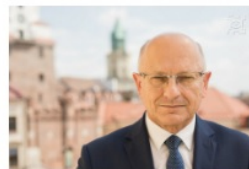
Krzysztof Żuk prezydent Lublina