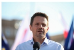
Rafał Trzaskowski prezydent Warszawy