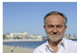
Wojciech Szczurek prezydent Gdyni

- Bardzo miłe informacje w niedzielny wieczór. Zostałem nominowany do