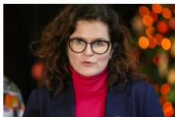
Aleksandra Dulkwicz prezydent Gdańska