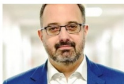
Łukasz Konarski prezydent Zawiercia