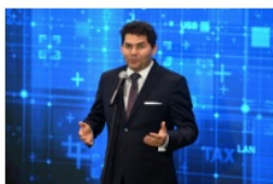
Lucjusz Nadberezny prezydent Stalowej Woli