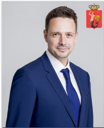
Rafał Trzaskowski Warszawa

Popularność prezydentów polskich miast w mediach społecznościowych na tle liczby mieszkańców miasta, którym zarządzają