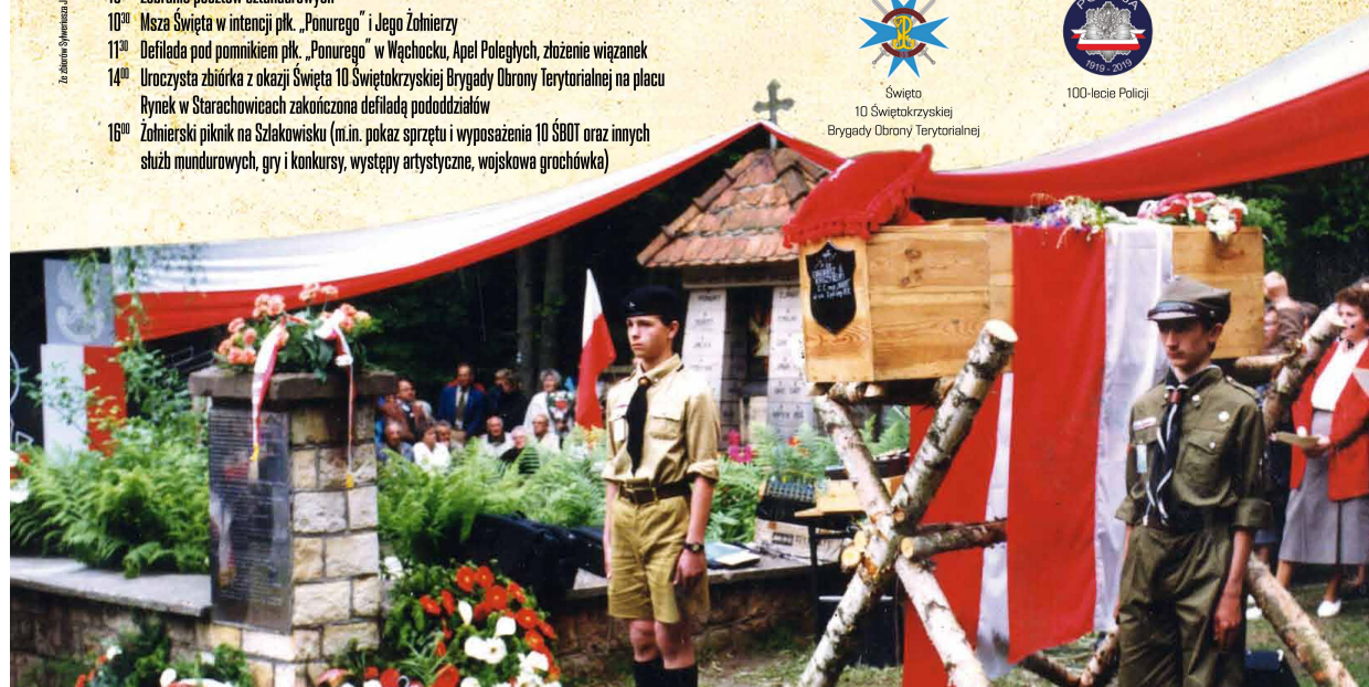
Wspiercy organizacyjnej i finansowej w organizacji uroczystości