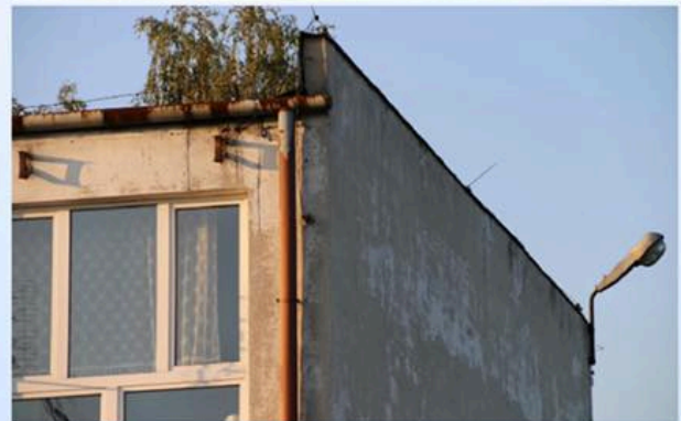
Zespół Szkół Zawodowych nr 3